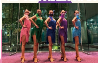
元朗區校際舞蹈比賽2022