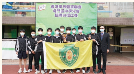
香港學界體育聯會屯門區中學分會學界田徑錦標賽男子乙組團體 (季軍)