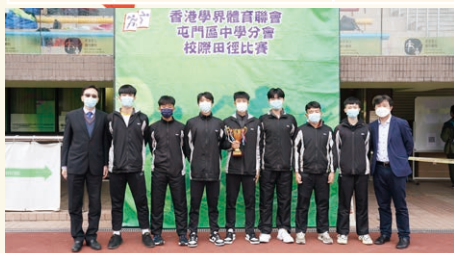
香港學界體育聯會屯門區中學分會學界田徑錦標賽男子甲組團體 (季軍)