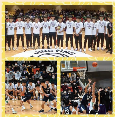
全港學界籃球精英賽殿軍