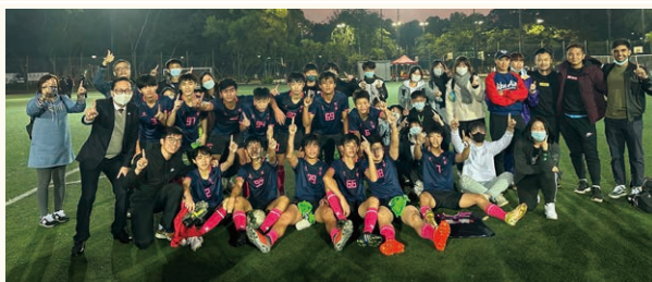
屯門區校際足球比賽男子高級組冠軍