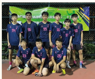
屯門區體育會舉辦「足球回歸杯」C組14-16歲亞軍