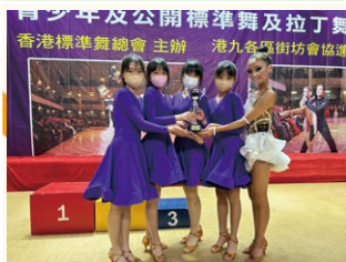
第2屆「國家盃」公開及青少年標準舞及拉丁舞大賽