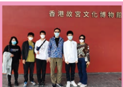
香港故宮文化博物館