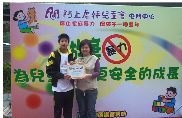
『防止家庭暴力---還孩子一個童年』 嘉年華會