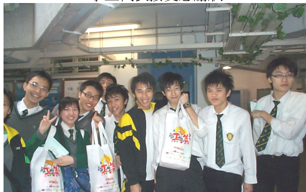
中七的同學不怕寒風、不怕重，把這份心意送給友愛邨區內長者