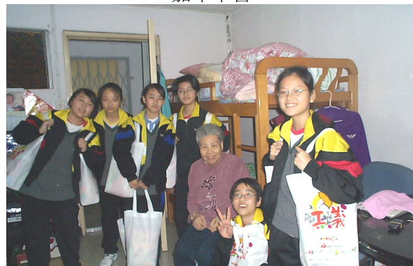
中二學生不讓學長專美，他們也把笑容和祝福送給長者