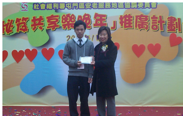
『健康秘笈共享樂晚年』分享會 學生代表接受感謝狀