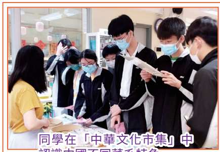
同學在「中華文化市集」中認識中國不同菜系特色。