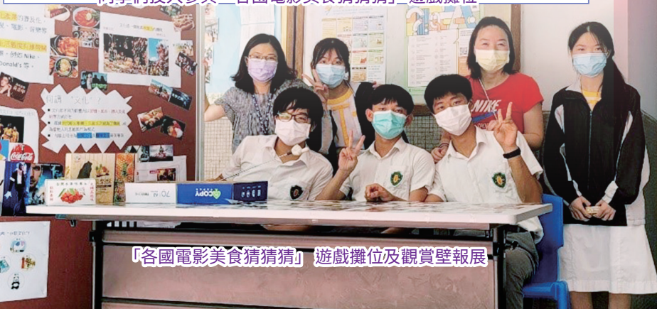
「各國電影美食猜猜猜」遊戲攤位及觀賞壁報展