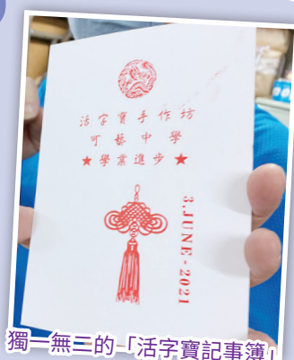
獨一無三的「活字實記事簿」