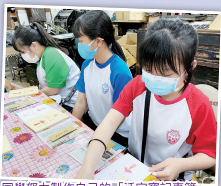
同學努力製作自己的「活字實記事簿」