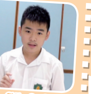
S1 & 2