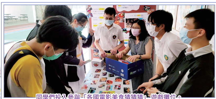
同學們投入參與「各國電影美食猜猜猜」遊戲攤位。

放學後，同學參與「各國電影美食猜猜猜」遊戲攤位及觀賞壁報展。同學為了得到世界各地的零食，都出盡渾身解數，全力參與。相信這兩天的活動都能令大家更明白文化全球化的意義。