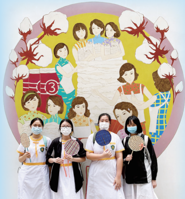
同學手持自製的竹扇於南豐紗廠合照留念。

「唧唧復唧唧，木蘭當戶織。不聞機杼聲，惟聞女嘆息。」家傳戶曉的《木蘭辭》，各位都耳熟能詳。編織是中國傳統手工藝術，學生會是次邀請到本地編織藝術家 Breakthrough Art Studio 教授同學編織竹扇技巧，參與同學可以體驗編織的樂趣，及親手製作一把獨一無二的竹扇。