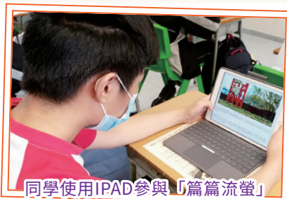
同學使用IPAD參與「篇篇流螢」網上閱讀計劃。

為了提高同學對中國文化、藝術的認識，讓同學透過多元化閱讀活動體會閱讀的樂趣和意義，圖書館、中文科、家政科、音樂科、視藝科、德育、公民及國民教育小組於4月12日（一）至16日（五）舉辦閱讀周，主題為「中華文化」。活動包括「中華文化市集」、「篇篇流螢」網上閱讀計劃和中國傳統節日展覽。