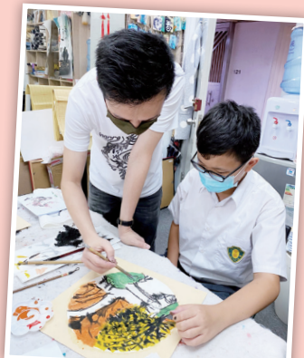
導師親身示範水墨畫上色技巧。