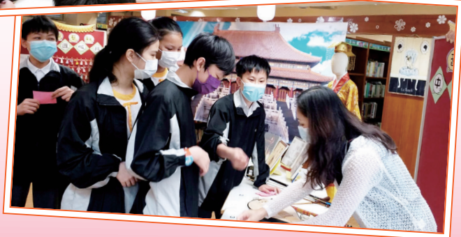
同學在「中華文化市集」中認識中國樂器知識。