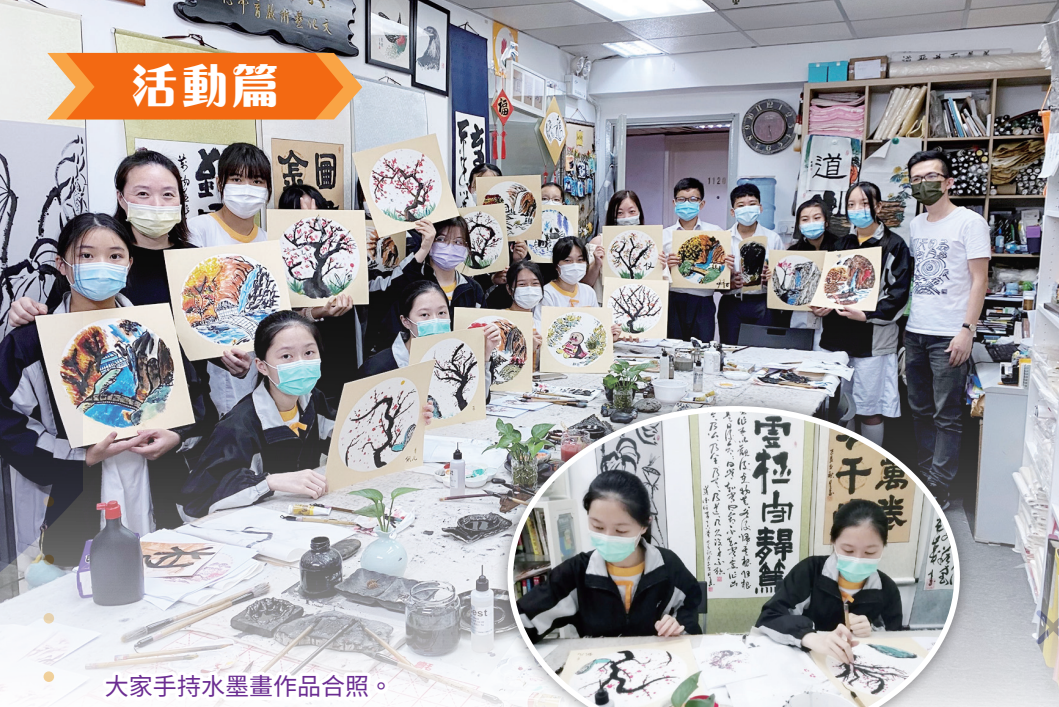
大家手持水墨畫作品合照。