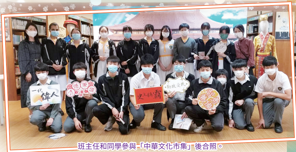
班主任和同學參與「中華文化市集」後合照。

為了提高同學對中國文化、藝術的認識，讓同學透過多元化閱讀活動體會閱讀的樂趣和意義，圖書館、中文科、家政科、音樂科、視藝科、德育、公民及國民教育小組於4月12日（一）至16日（五）舉辦閱讀周，主題為「中華文化」。活動包括「中華文化市集」、「篇篇流螢」網上閱讀計劃和中國傳統節日展覽。