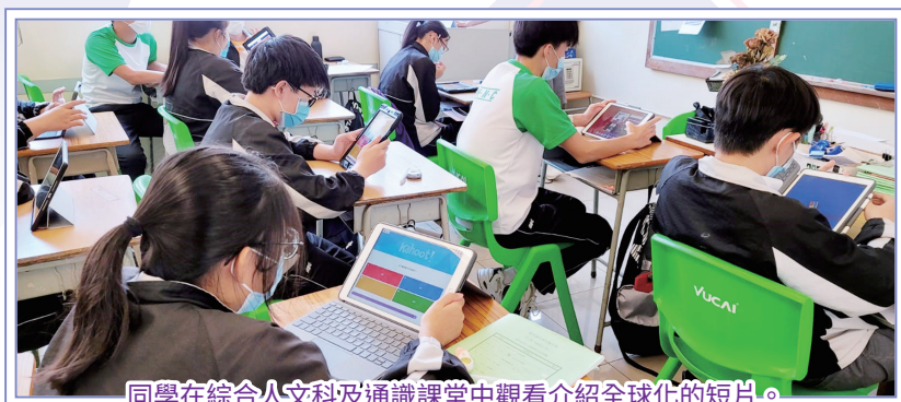
同學在綜合人文科及通識課堂中觀看介紹全球化的短片。

通識及家政科在5月20日（四）至21日（五）合辦了以「認識文化全球化」為主題的學習日。在這兩天內，同學透過初中的綜合人文科、家政科，以及高中的通識科和科技與生活科，跨領域地學習文化全球化的特徵和例子。