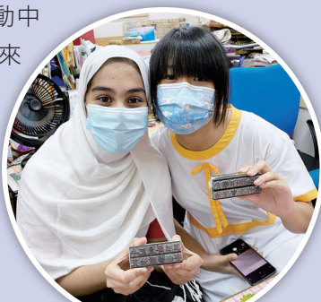
同學手持鉛字粒合照。