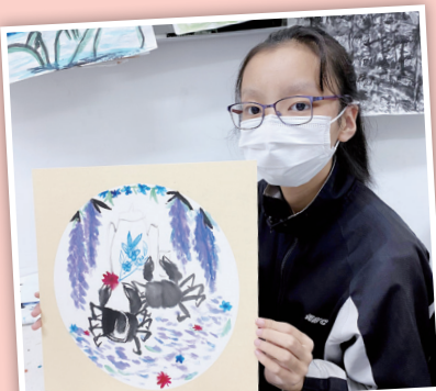
看看同學作品中的螃蟹多活靈活現！