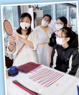
導師向同學講解竹扇的編織紋理。