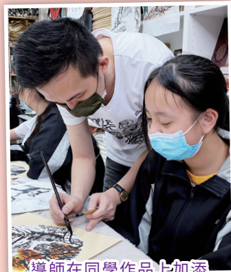
導師在同學作品上加添幾筆，畫出古風小橋。

為讓同學認識中華文化，學生會及美術學會於2021年6月2日（三）舉辦水墨畫工作坊，體驗非一般學校活動，輕鬆學習。兵書館文化藝術中心透過藝術引入創價值、自我實現為目標，引導學生正確人生觀。工作坊讓同學獨立完成一幅屬於自己的畫，培養同學在急而不燥中最大程度的完成畫作，並且從中體會國畫的精髓。