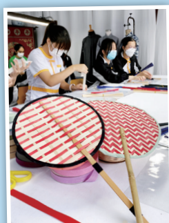
同學在努力製作屬於自己的竹扇。