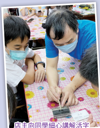
店主向同學細心講解活字印刷排版技巧。