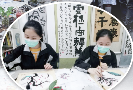
同學優雅靜心地繪畫水墨畫。