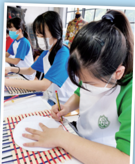
同學在編織好的竹條上畫出竹扇的外廓。