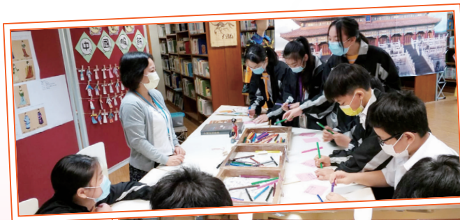
同學在「中華文化市集」中設計傳統中國服飾。